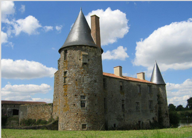
Château de la Grève à St-Martin-des-Noyers