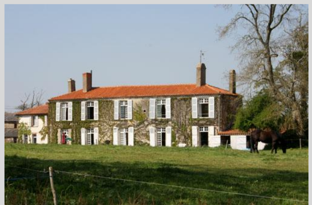
La Grassière à St-Mathurin