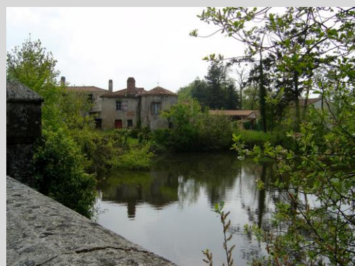
Château de la Burcerie