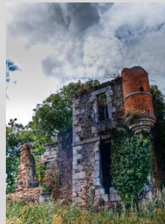
Ruines du château de la Lière