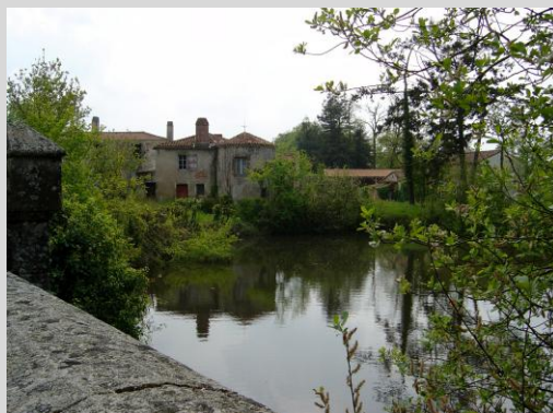
Château de la Burcerie

2°) Louise Victoire Aimée BAUDRY , née à La Boissière-des-Landes le 29 octobre 1767, décédée à St-Georges-de-Pointindoux le 9 janvier 1832. Elle avait épousé à Poiroux le 2 brumaire an VII (23 octobre 1798), Gilles MERCIER-COLOMBIÈRE , baptisé aux Sables d'Olonne le 17 mars 1767, avocat, arrêté pour ses imprudences de langage et libéré le 8 mai 1793, mais réincarcéré le 18 juillet suivant en même