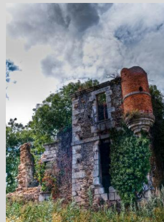
Ruines du château de la Lière