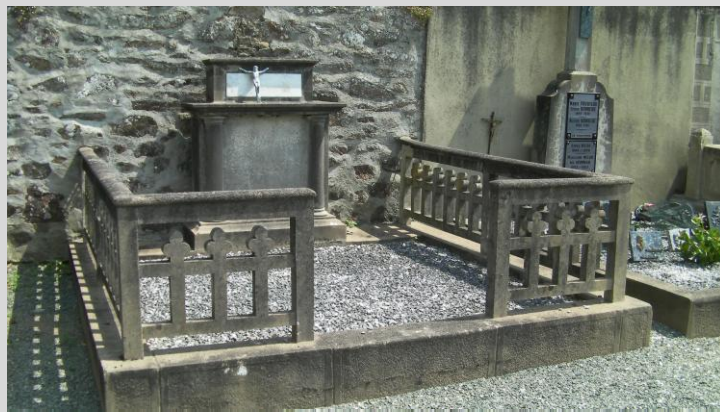
Sépulture Cacaud aux Essarts