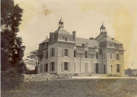
La Chesnelie vers 1912

C'est Joseph DUCHAINE qui élabore les plans du parc et du château qui sera construit par l'architecte Libaudière entre 1911 et 1913. Il est situé à la Boissière des Landes à la limite de la commune de Saint Avaugourd des Landes. C'est une gracieuse bâtisse dont la légèreté est due aux deux clochetons desquels on pouvait voir le phare des Baleines à l'île de Ré. En 1977 Charles DUCHAINE supprime ces clochetons à l'occasion de la réfection de la toiture devenue indispensable.