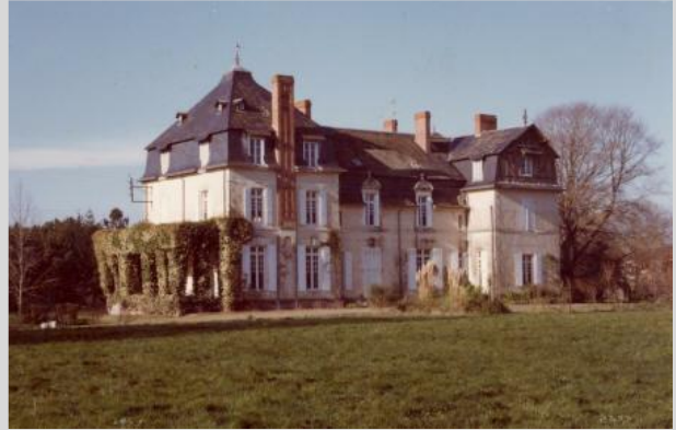
La Chesnelie vers 1990