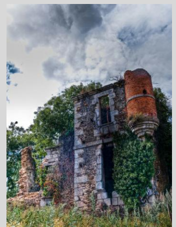
Ruines du château de la Lière