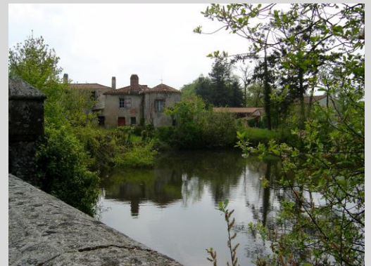
Château de la Burcerie