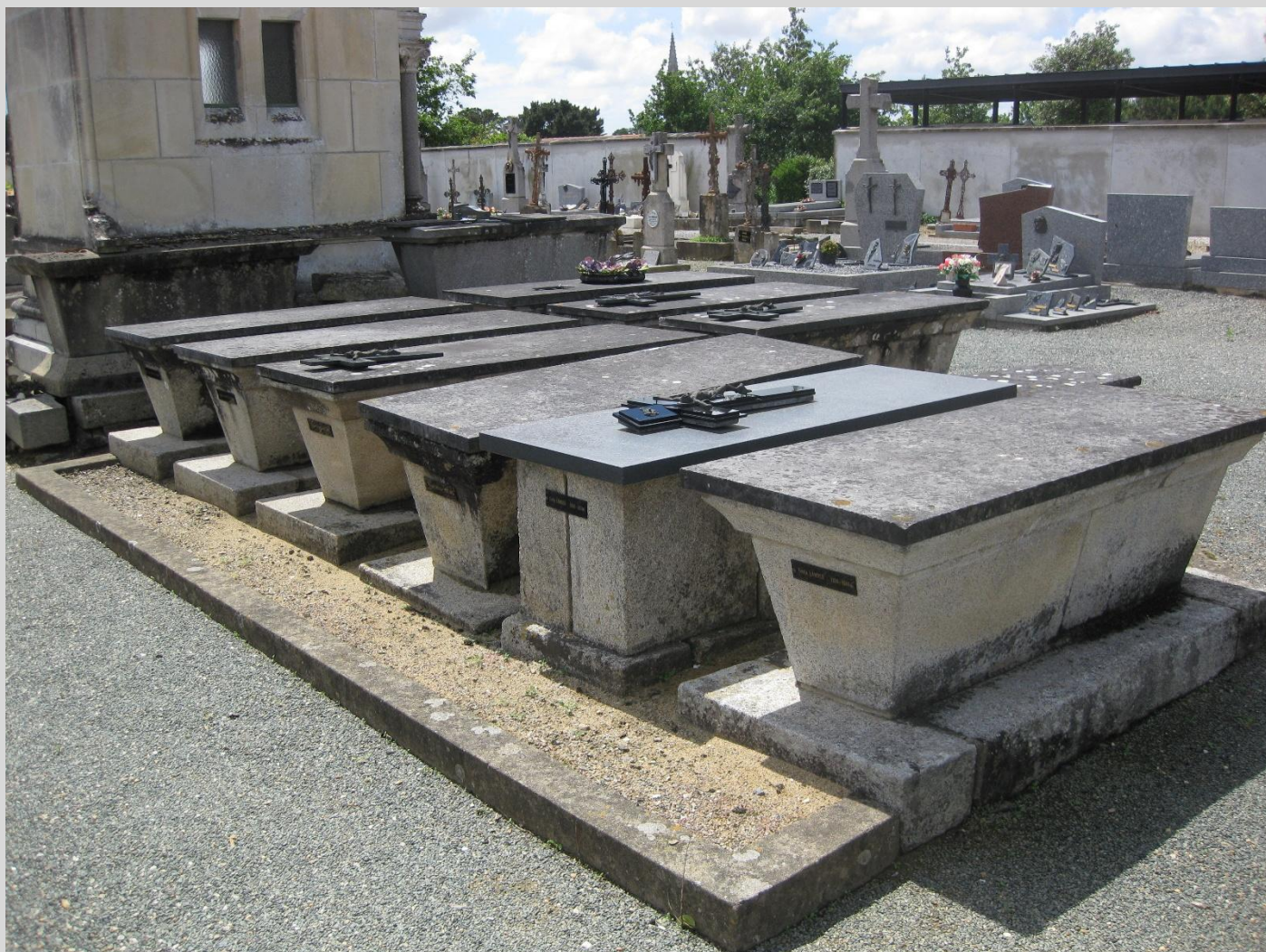
Sépulture de la famille LANSIER dans le cimetière de La Mothe Achard