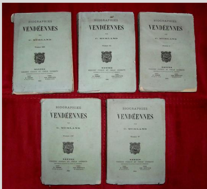
Les 5 volumes des « Biographies Vendéennes » de Charles MERLAND (Coll. Christian Frappier)

7°) Virginie MERLAND , décédée au Château d'Olonne le 28 juillet 1862.