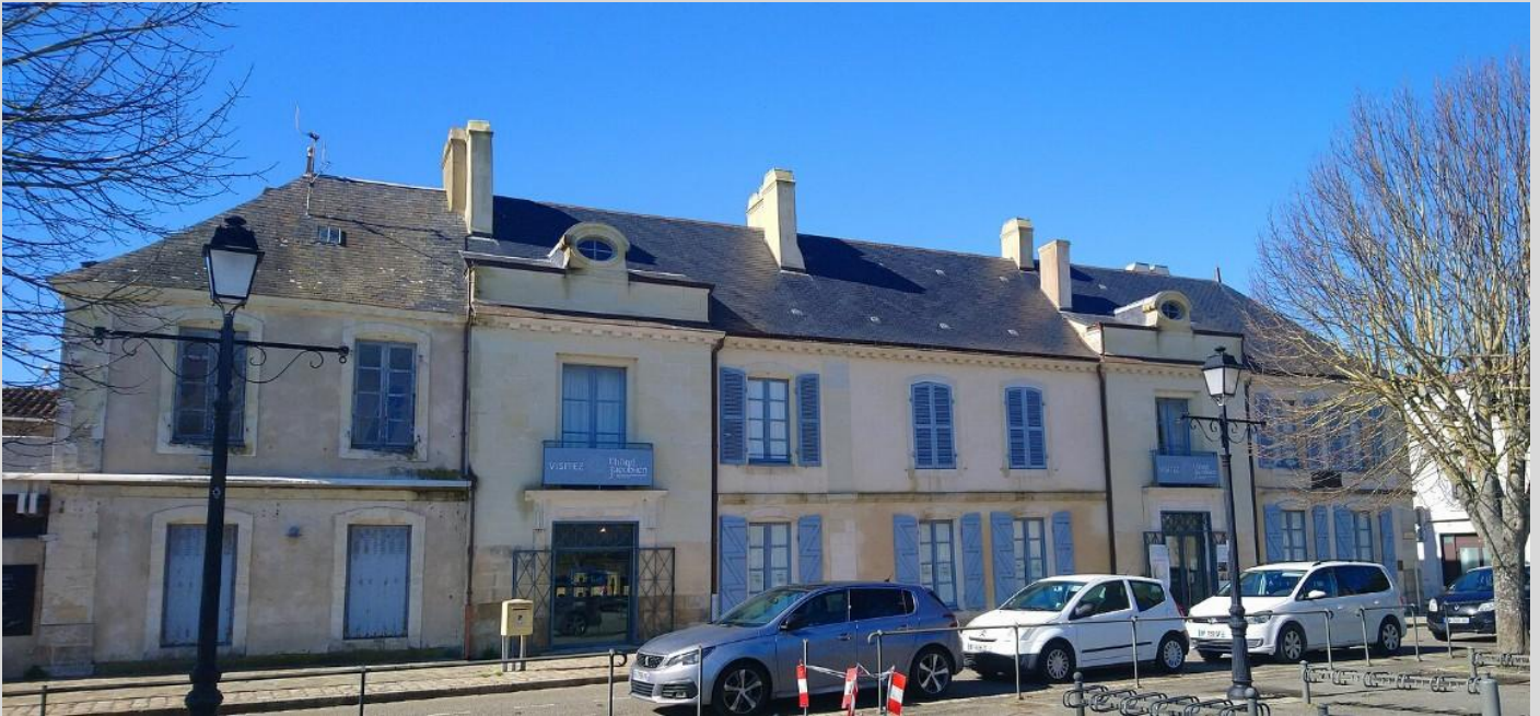
L'ancien hôtel particulier de la famille JACOBSEN