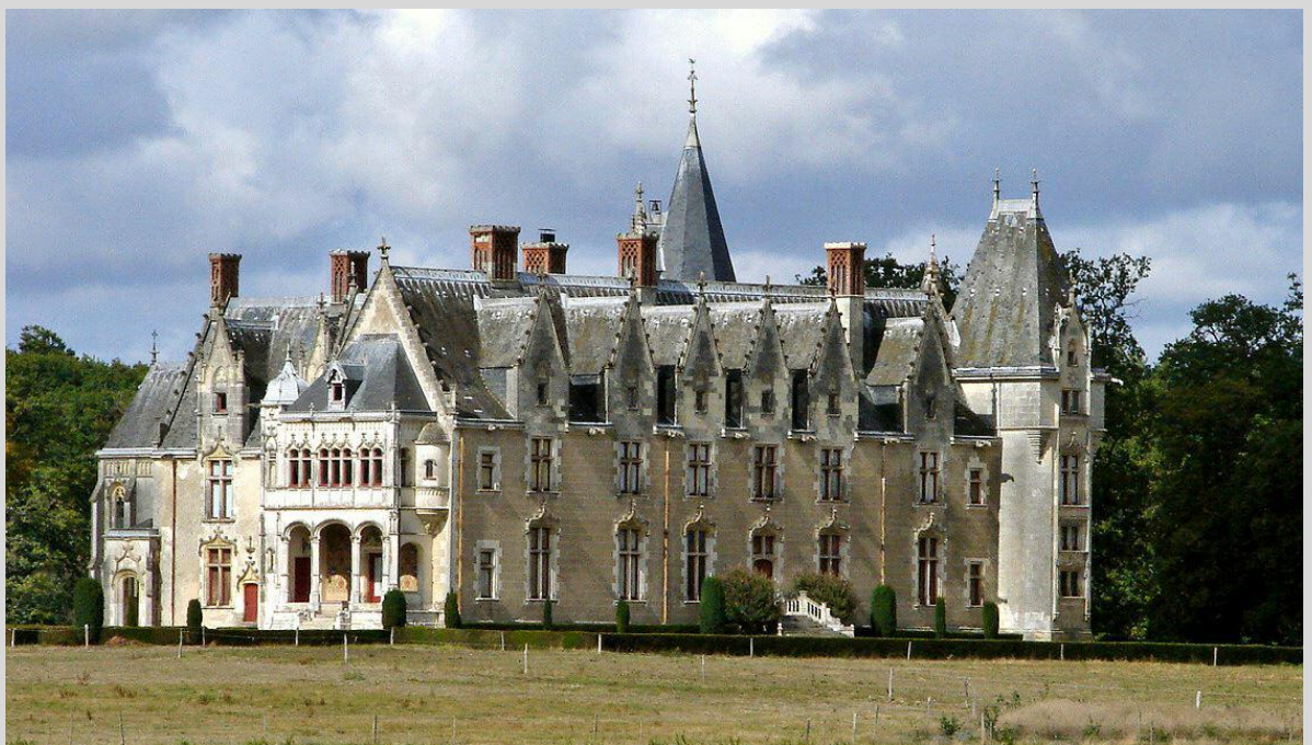
Château de la Gascherie à La Chapelle-sur-Erdre (et sur les bords de l'Erdre !)

Bénéficiant de la Loi de réhabilitation votée au début des années 80, il est promu commandeur de la Légion d'honneur en 1996, puis reçoit de Jacques CHIRAC le grand cordon de l'ordre au cours d'une cérémonie privée.