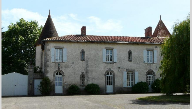
Le Pin Macé à La Mothe-Achard