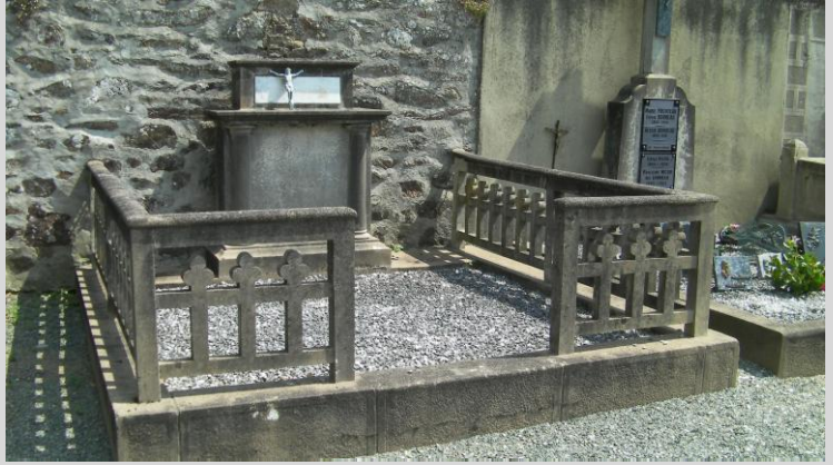
Sépulture Cacaud aux Essarts