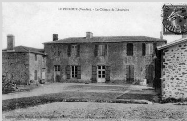
Photo de l'Audraire de Poiroux venant des Linyer.