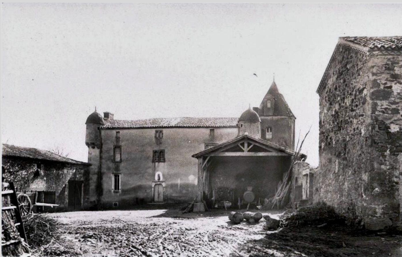
Le Colombier à Mouchamps