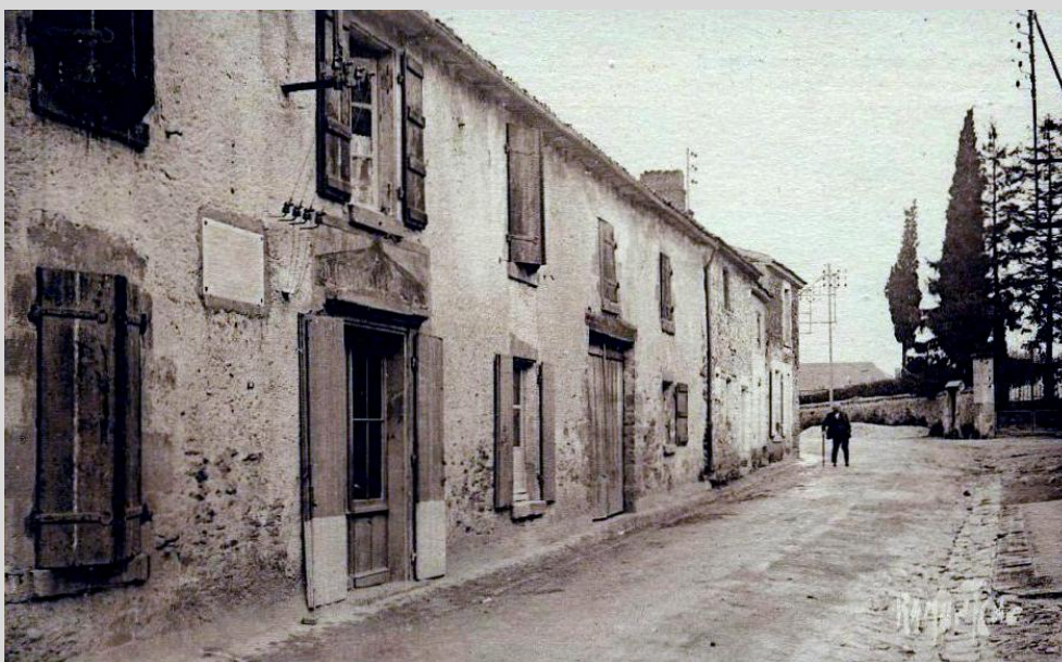
Maison natale de Georges CLEMENCEAU