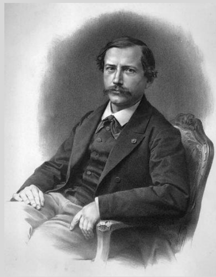
Paul MEURICE, écrivain et Marcellin BERTHELOT, chimiste