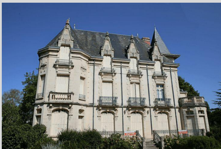
Château du Plessis à La Roche-sur-Yon construit pour la famille Gendreau

En 1903, ils eurent l'idée de mettre en commun leur intelligence, leur activité, leurs capitaux et leurs efforts, pour créer en Vendée, leur pays d'origine, une industrie capable d'assurer aux producteurs un précieux débouché à leurs élevages. Ils firent ainsi construire une immense usine, munie de l'outillage le plus moderne et le plus perfectionné. Peu de temps après l'ouverture de leur établissement, ils eurent la satisfaction de recevoir une commande du ministère de la Guerre, de deux cent mille boîtes de conserves de viande de bœuf pour la troupe.