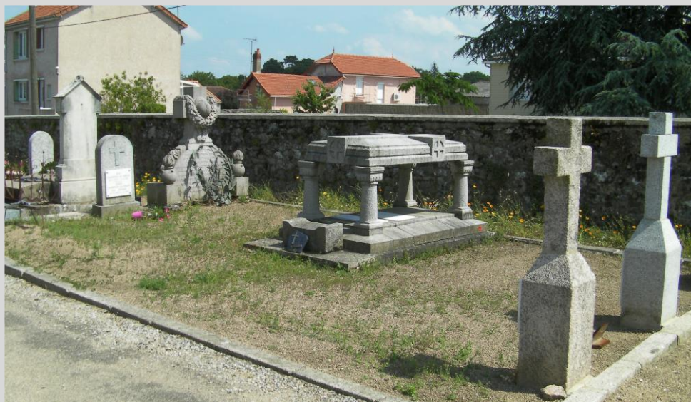
Ci-dessus, la sépulture Esgonnière dans le cimetière de Bournezeau