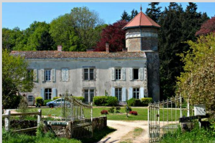
Photo : La Guissière à Beaulieu-sous-la-Roche