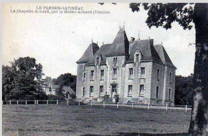
Photo : le Plessis-Gâtineau à La Chapelle-Achard