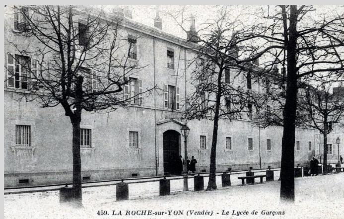
459. LA ROCHE-sur-YON (Vendée) - Le Lycée de Garçons

Il retrouve la présidence de la Chambre en 1947. En 1953, sa santé s'est altérée, et à la fin de l'année, il ne peut même pas présider l'élection du Président de la République et est remplacé par André Le Troquer. Le 30 août 1954, il fait une ultime intervention devant la Chambre des