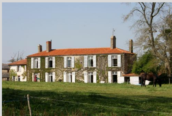
La Grassière à St-Mathurin